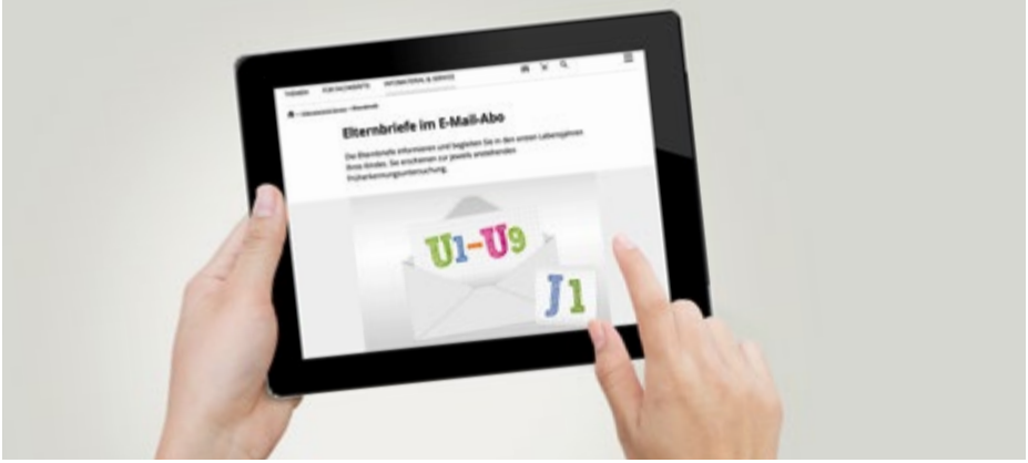
رسائل الوالدين على - kindergesundheit-info.de تذكير بالبريد الإلكتروني لموعدك القادم