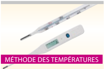
MÉTHODE DES TEMPÉRATURES