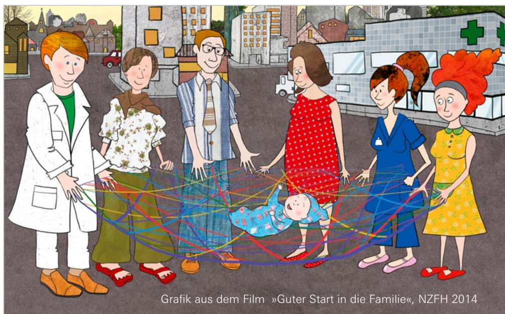
Grafik aus dem Film »Guter Start in die Familie«, NZFH 2014