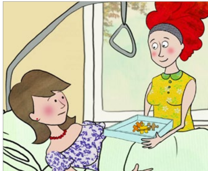
Lotsendienste in Geburtskliniken vermitteln Frühe Hilfen passgenau und frühzeitig.

Die Versorgung von Familien mit psychosozialen Belastungen ist für das geburtshilfliche Personal aufgrund von