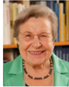
Prof. Dr. Dr. h.c. Ursula Lehr

R obert Lembke brachte es einst auf den Punkt: „Alt werden ist natürlich kein reines Vergnügen. Aber denken wir an die einzige Alternative.“ Das Alter bringt ganz unterschiedliche Veränderungen mit sich, die uns immer wieder von Neuem herausfordern. Mit einer davon setzt sich diese Broschüre auseinander: das Nachlassen der Sehkraft. Doch auch wenn die Augen schwächer werden, schwinden noch lange nicht alle Fähigkeiten, die Sie im Laufe eines langen Lebens erworben haben. Ein selbstbestimmtes Leben, die Teilhabe an der Gesellschaft – lassen Sie sich das nicht nehmen. Auf den folgenden Seiten finden Sie viele Informationen, die Ihnen dabei helfen.“