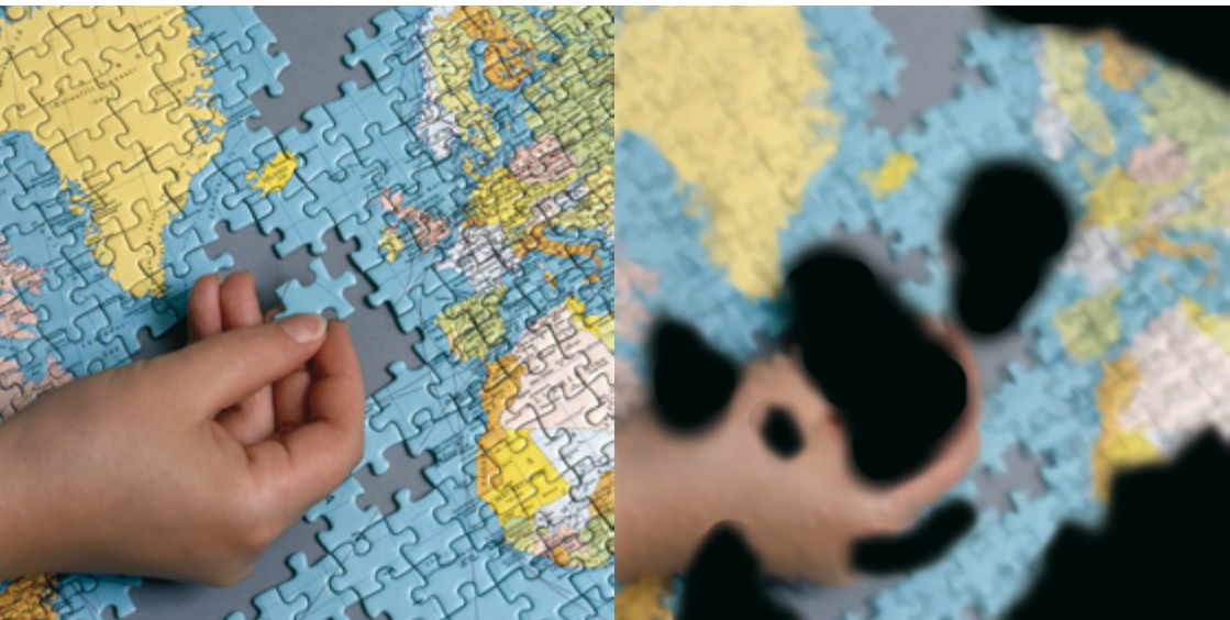
Normaler Seheindruck (links); Seheindruck mit fortgeschrittener diabetischer Netzhauterkrankung (rechts)

Ein dauernd erhöhter Blutzuckerspiegel schädigt die Blutgefäße, auch die der Netzhaut. Blutungen und auch die Neubildung krankhafter Gefäße sind möglich. Diese bedrohen das Sehvermögen. Die Netzhauterkrankung verläuft zunächst ohne auffällige Symptome. Deshalb bemerken viele Menschen sie erst sehr spät. Doch gerade zu Beginn der Krankheit sind die Behand-