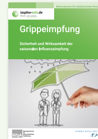
Broschüre Medizinisches Personal, 'Sicherheit und Wirksamkeit' (DIN A6)

Erhältlich in: DE und als PDF-Download: DE