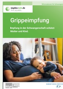
Broschüre Schwangere (DIN A6)

Erhältlich in: DE und als PDF-Download: DE EN TR RU AR UA