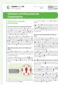
Merkblatt „Sicherheit und Wirksamkeit“ (DIN A4)

Erhältlich als Abreißblock in: DE und als PDF-Download: DE EN TR RU AR UA