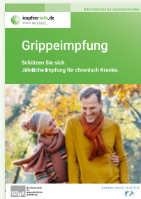
Broschüre Chronisch Kranke (DIN A6)

Erhältlich in: DE und als PDF-Download: DE EN TR RU AR UA