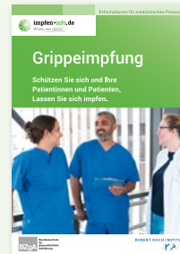
Broschüre Medizinisches Personal (DIN A6)

Erhältlich in: DE und als PDF-Download: DE EN TR RU AR UA