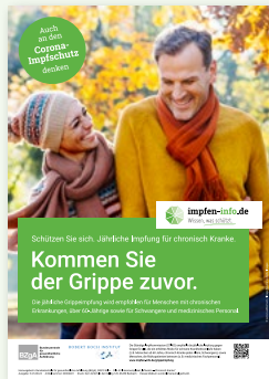
Plakat Chronisch Kranke (DIN A3)

Erhältlich in: DE und als PDF-Download: DE