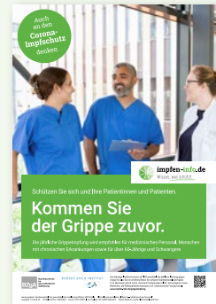
Plakat Medizinisches Personal (DIN A3)

Erhältlich in: DE und als PDF-Download: DE