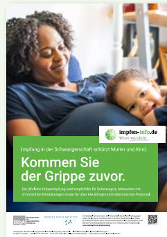
Plakat Schwangere (DIN A3)

Erhältlich in: DE und als PDF-Download: DE