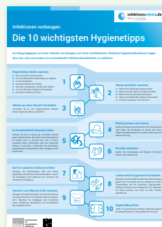
Plakat „10 Hygienetipps“ (DIN A2)

Erhältlich in: DE und als PDF-Download: DE