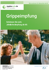
Broschüre Menschen ab 60 (DIN A6)

Erhältlich in: DE und als PDF-Download: DE