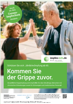
Plakat Menschen ab 60 (DIN A3)

Erhältlich in: DE und als PDF-Download: DE