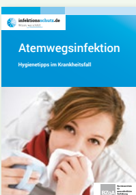
Broschüre „Atemwegsinfektionen“ (DIN A6)

Erhältlich in: DE und als PDF-Download: DE