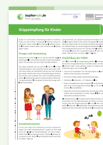
Merkblatt „Grippeimpfung für Kinder“ (DIN A4)

Erhältlich als Abreißblock in: DE und als PDF-Download: DE EN TR RU AR UA