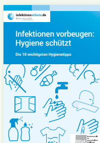
Broschüre „10 Hygienetipps“ (DIN A6)

Erhältlich in: DE und als PDF-Download: DE